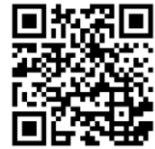
宮城県 HP 新型コロナ対策サイト

県内で感染拡大が続いています。この夏休み中は、たくさんの児童生徒や家族の皆さんから陽性判定や濃厚接触の報告を受けました。いよいよ学校が始まりましたが、校内で感染拡大が起こらないように十分に気を付けていきたいと思っておりますので、ご理解とご協力をお願いいたします。